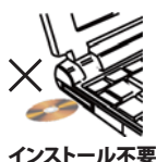
インストール不要